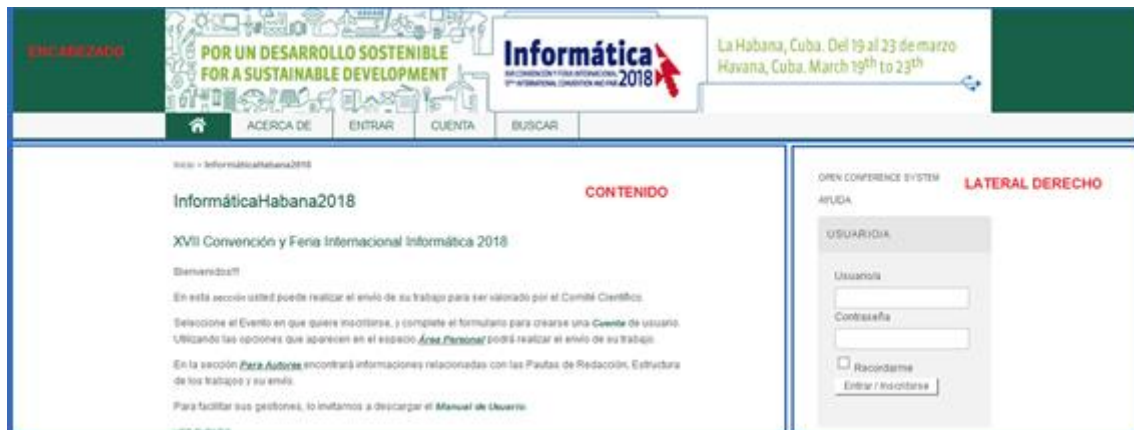
Figura 2. Áreas que componen el sitio.