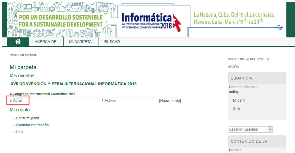
Figura 8. Vista del autor.