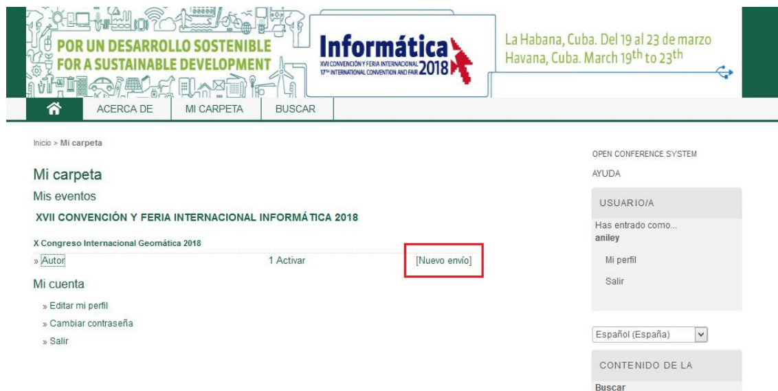
Figura 10. Opción Nuevo envío.

Para hacer un envío de trabajo a un evento, el autor debe seleccionar la opción Nuevo Envío que aparece en su Área personal, teniendo en cuenta el evento al que desea realizar dicho envío, ver Figura 10.